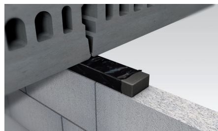
Bovenzijde van een muur